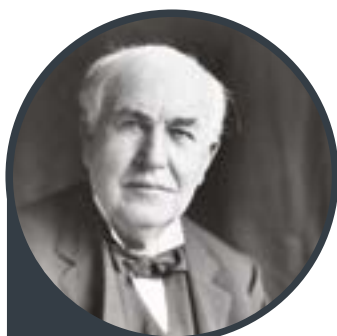
Thomas Edison - empreendedor, inventor e cientista norte-americano

“Nossa maior fraqueza está em desistir. O caminho mais certo de vencer é tentar mais uma vez”