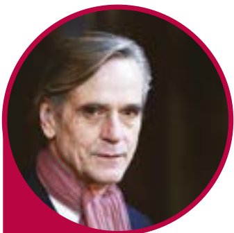
Jeremy Irons - ator britânico

“Todos nós temos nossas máquinas do tempo. Algumas nos levam pra trás, são chamadas de memórias. Outras nos levam para frente, são chamadas sonhos”