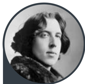
Oscar Wilde - Escritor e poeta irlandês

“Aqueles que não fazem nada estão sempre dispostos a criticar os que fazem algo”