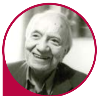
Mario Quintana - Poeta, tradutor e jornalista gaúcho, falecido em maio de 1994

“A resposta certa, não importa nada: o essencial é que as perguntas estejam certas”