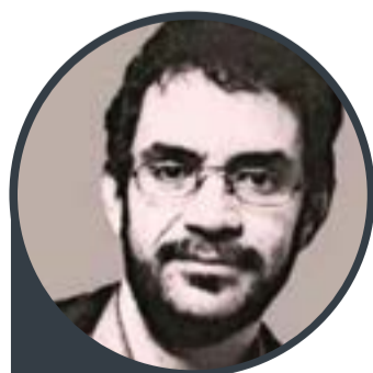
Renato Russo - compositor e cantor brasileiro

Quando tudo nos parece dar errado acontecem coisas boas que não teriam acontecido se tudo tivesse dado certo.