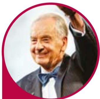
“Zig” Ziglar - escritor e vendedor americano

Se as pessoas gostarem de você, elas escutarão o que você tem a dizer; mas, se elas confiarem em você, então elas estarão dispostas a comprar aquilo que você está vendendo