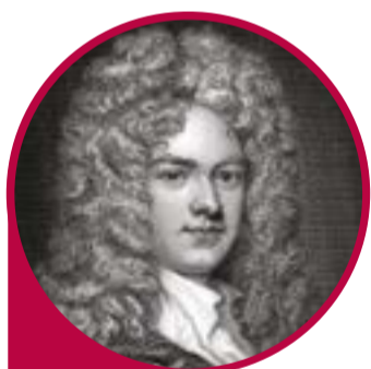
Joseph Addison - Poeta e político inglês

“Se quiser triunfar na vida, faça da perseverança a sua melhor amiga; da experiência, o seu conselheiro; da prudência, o seu irmão mais velho; e da esperança, o seu anjo da guarda”