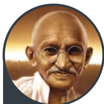
Mahatma Gandhi - Líder pacifista indiano

“O futuro dependerá daquilo que fazemos no presente”