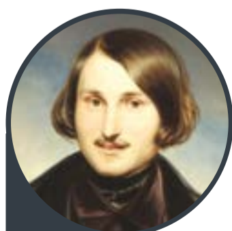
Nicolau Gogol - Escritor russo

“Fixe o olhar com mais atenção no presente; o futuro chegará sozinho, inesperadamente. É tolo quem pensa no futuro antes de pensar no presente”