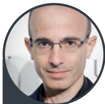
Yuval Noah Harari - professor israelense de História e autor de best-sellers

“Dispomos de mais opções do que nunca, porém perdemos a habilidade de realmente prestar atenção no que escolhemos”