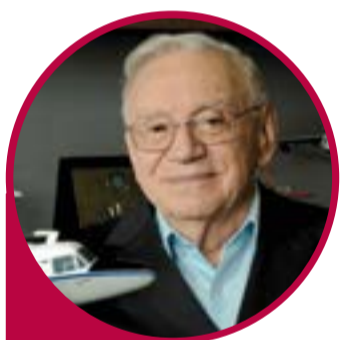
Ozire Silva - engenheiro aeronáutico brasileiro, presidente e cofundador da Embraer

“O que sempre me moveu foi a inquietação de perguntar se não existe uma maneira melhor de fazer algo”